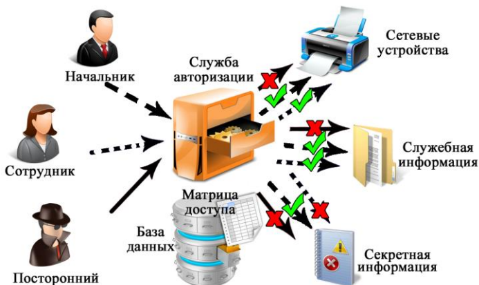
Рисунок 1 – Схема реализации дискреционного управления доступом